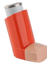
Prendre son traitement de fond