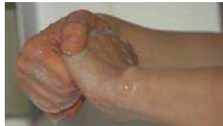
Lavage de mains