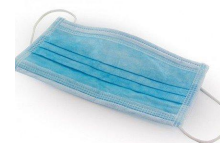
Port du masque chirurgical